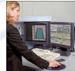
Projektierung und Systemmontage durch RK