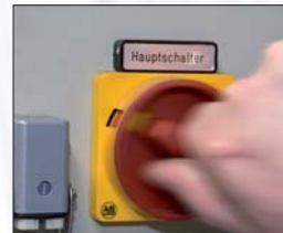
Die Anlage wird abgeschaltet.

* Steuerungsablauf muss angepasst werden