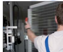
Das Haltesystem der Linearachse ist aktiviert, die Z-Achse somit gegen vertikales Absacken gesichert. Der Sicherheitsbereich kann betreten werden.