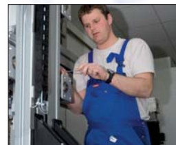
Wartungs- und Einrichtarbeiten können gefahrlos durchgeführt werden.