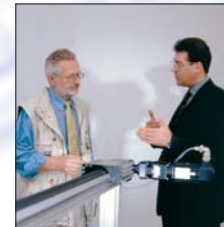
Ihr Anforderungsprofil – Produktberatung vor Ort

RK kann bereits auf eine langjährige Erfahrung in der Entwicklung und Herstellung von Linearsystemen zurückgreifen. Unsere Produktspezialisten beraten und unterstützen Sie gerne bei der Realisierung eines Systems.