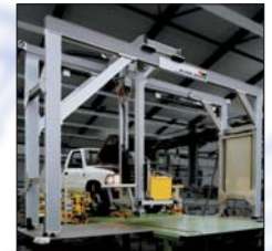
Linearsystem im Einsatz